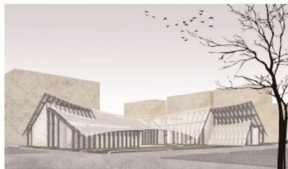
PERSPECTIVE (WESTVIEW BY S. GASTROU) Standing at the entrance the rooftop is convincing, surrounding the new square and the walk at the entrance guide visitors to the new ground. The perspective from the original landmark shows a series of varied rooftops. The "baker's" rooftop creates space for people to shelter from the weather part of the design.