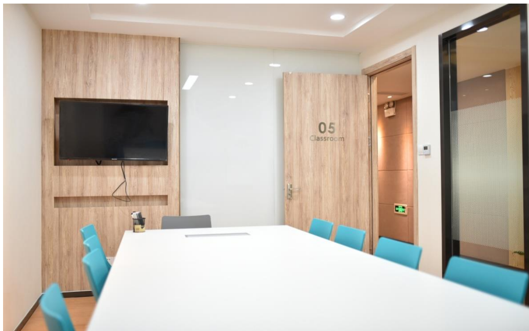
校区一览---来福士校区