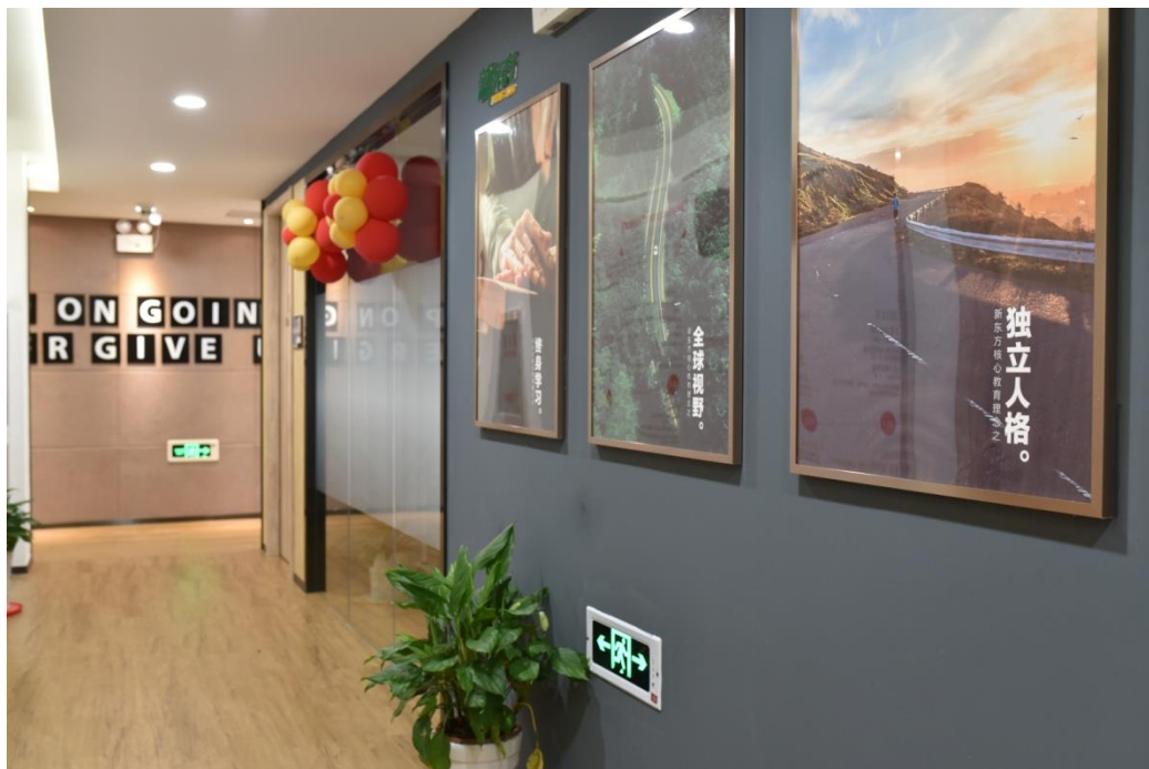
校区一览---万达校区