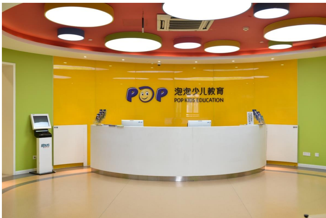
校区一览---中心校区