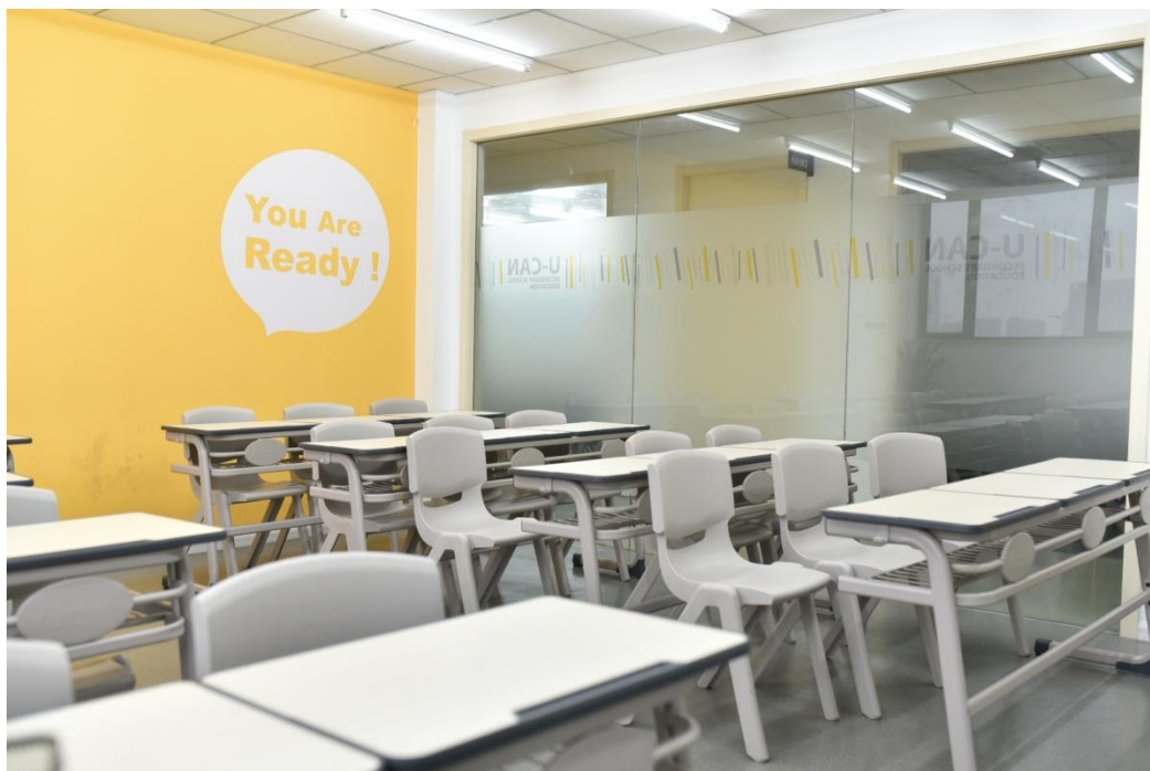
校区一览---百丈校区