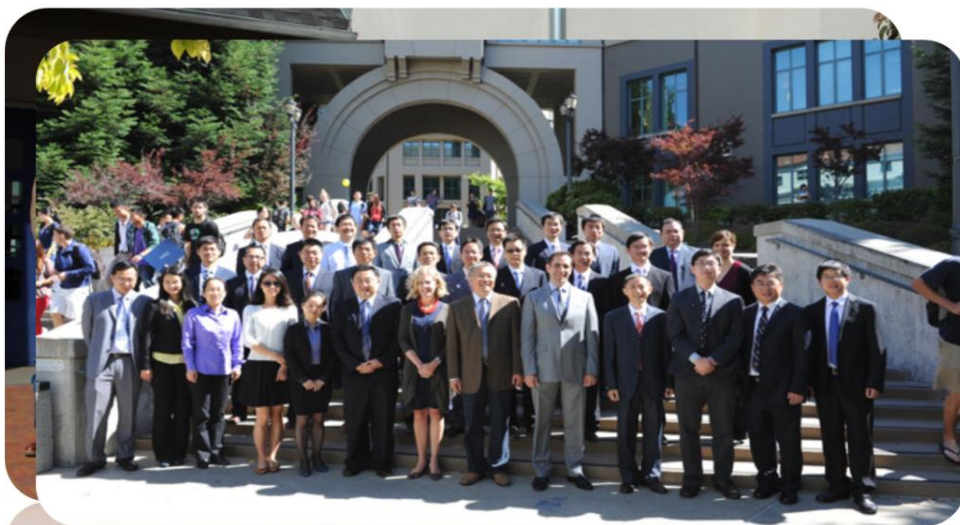
历届赴美国国际工程项目管理培训班学员合影